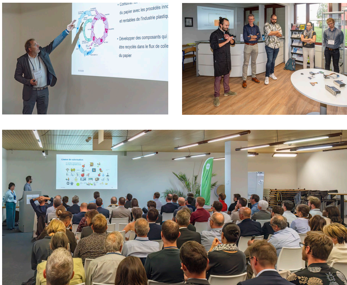
Figure 1 : Photographies de l'événement INNO SQUARE@MIC du 10.10.2023

Etablies dans les laboratoires d'iPrint, les entreprises internationales Epson et Markem Image et la startup Droptimize ont exposé leurs récentes avancées technologiques dans le domaine de l'impression alimentaire, du marquage de produits et de la mise au point de procédés liés à l'impression à jet d'encre. Les startups Bloom Biorenewables et Impossible Materials, toutes deux figurant dans le top 100 des startups suisses, et Revario ont attiré l'attention par leurs solutions novatrices.